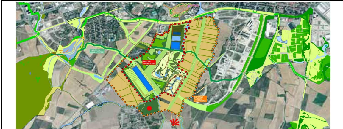
Larragorri izeneko parkearen diseinua, 2018ko “2025 Estrategia” delako dokumentuan.

Eremuaren zati handi batean (100 ha inguru) hiri-parke bat egiteko asmoa dago aspalditik, Larragorri izenekoa [1], proiektua oso definituta ez badago ere. Gaur egun, parke horretako urmael nagusia ari dira eraikitzen [2], eta beste guztia ez dago erabat ziurtatuta egingo denik. Beraz, parkea erabat alda liteke —urmaela eraikitzen ari direla kontuan hartuz—, ondo justifikatuz gero.