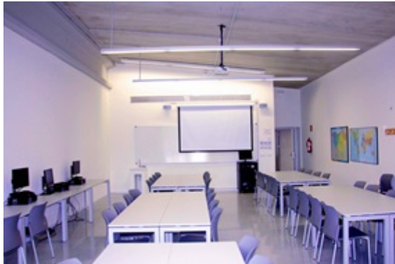
Gizarte Zientzien Laborategia