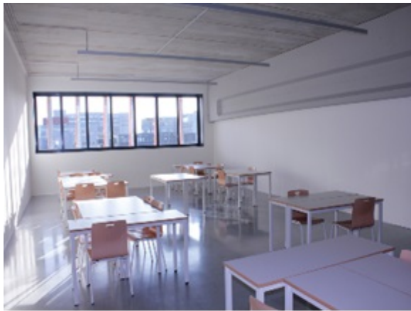
Taldeka ikasteko gela