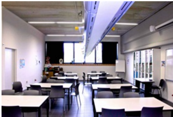
Geologia eta Biologia Laborategia