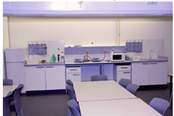
Laboratorio de Física y Química