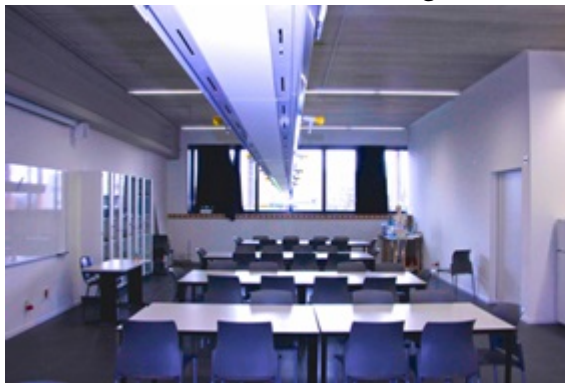
Fisika eta Kimika Laborategia