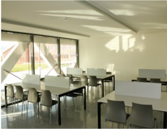
Bakarrik ikasteko gela