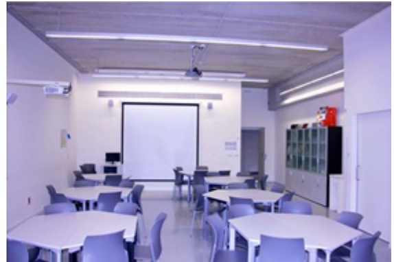
Laboratorio de Matemáticas