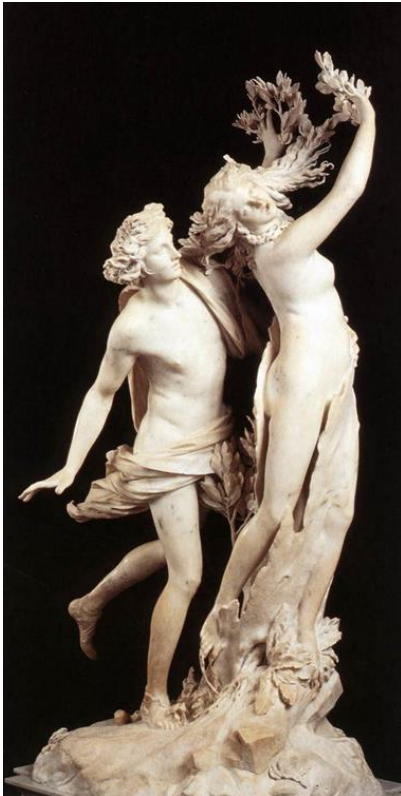
Apolo eta Dafne