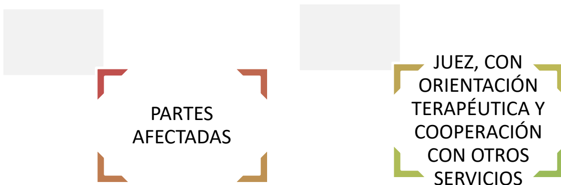
Ilustración 2: Principales protagonistas de la justicia orientada a los problemas