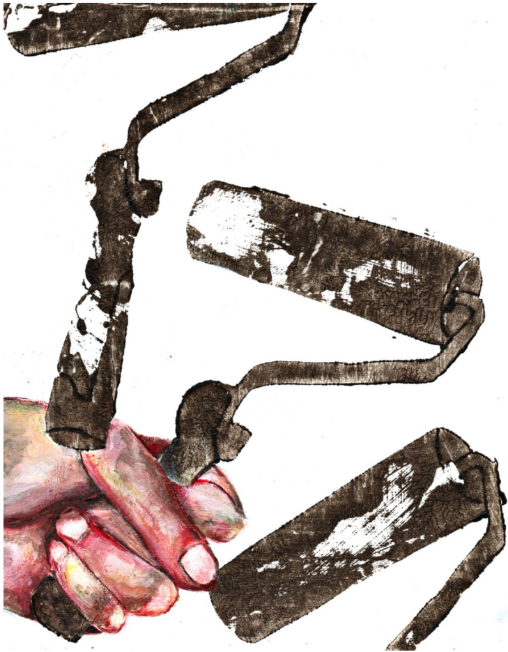
Xilografia ta pintura 20x25