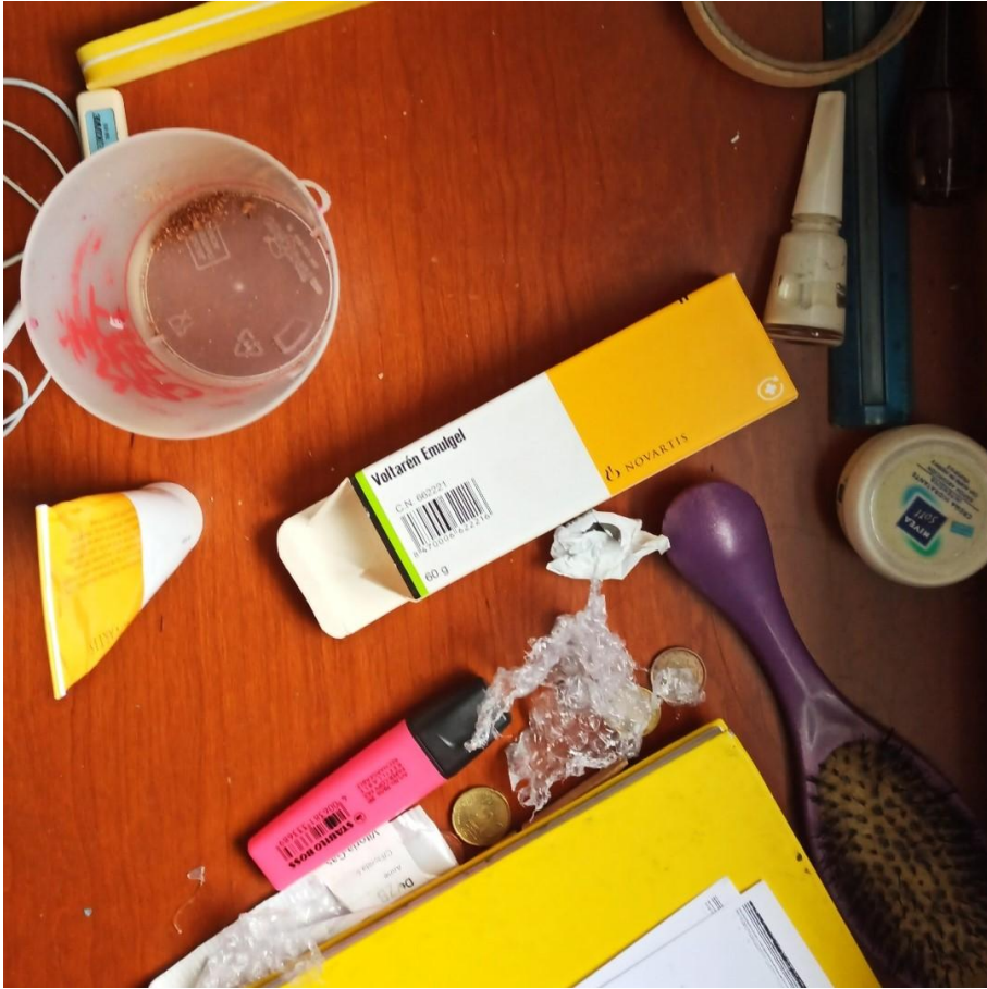
Nire logelako mahaia 03/21