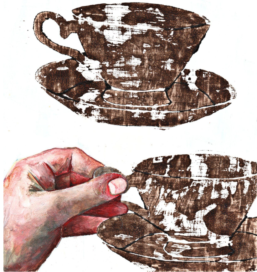
Xilografia eta pintura 20x25