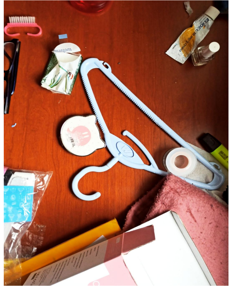
Nire logelako mahaia 04/21