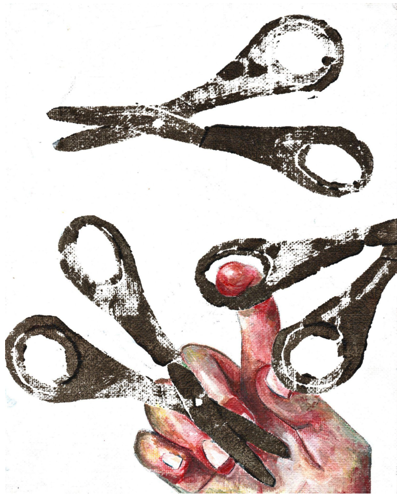
Xilografia eta pintura 20x25