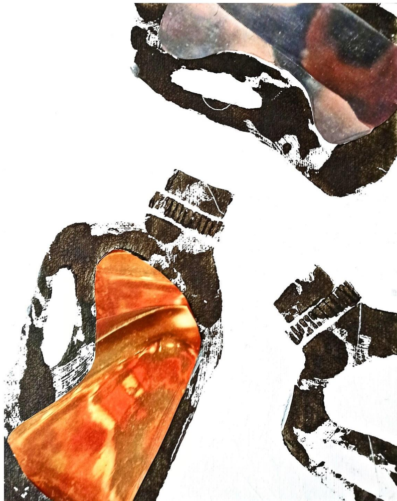
Xilografia eta collage 20x25