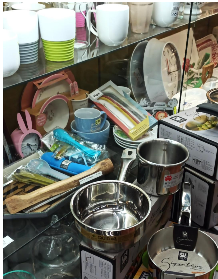
“Katxarritos” denda, Gasteiz