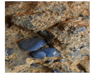
Zenbait anfibol: riebekita, magnesoriebekita...

Nesse, W. Mineralogiaren hastapenak , EHU, 2013. Itzul.: Ixiar Iza