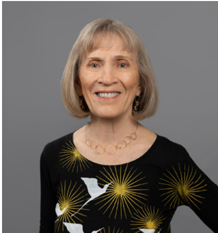
Claudia Goldin. Ekonomiako Nobel Saria 2023

Ekonomia eta Enpresa Fakultateko Berdintasun Batzardea