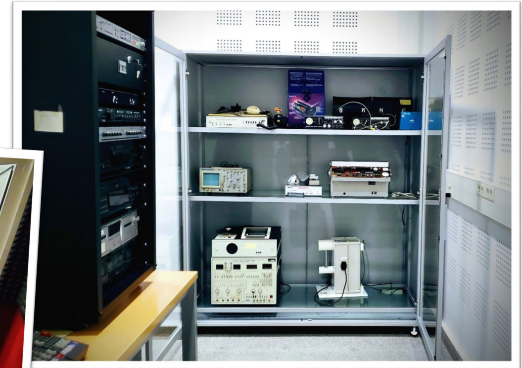
Aparato zaharren museoa