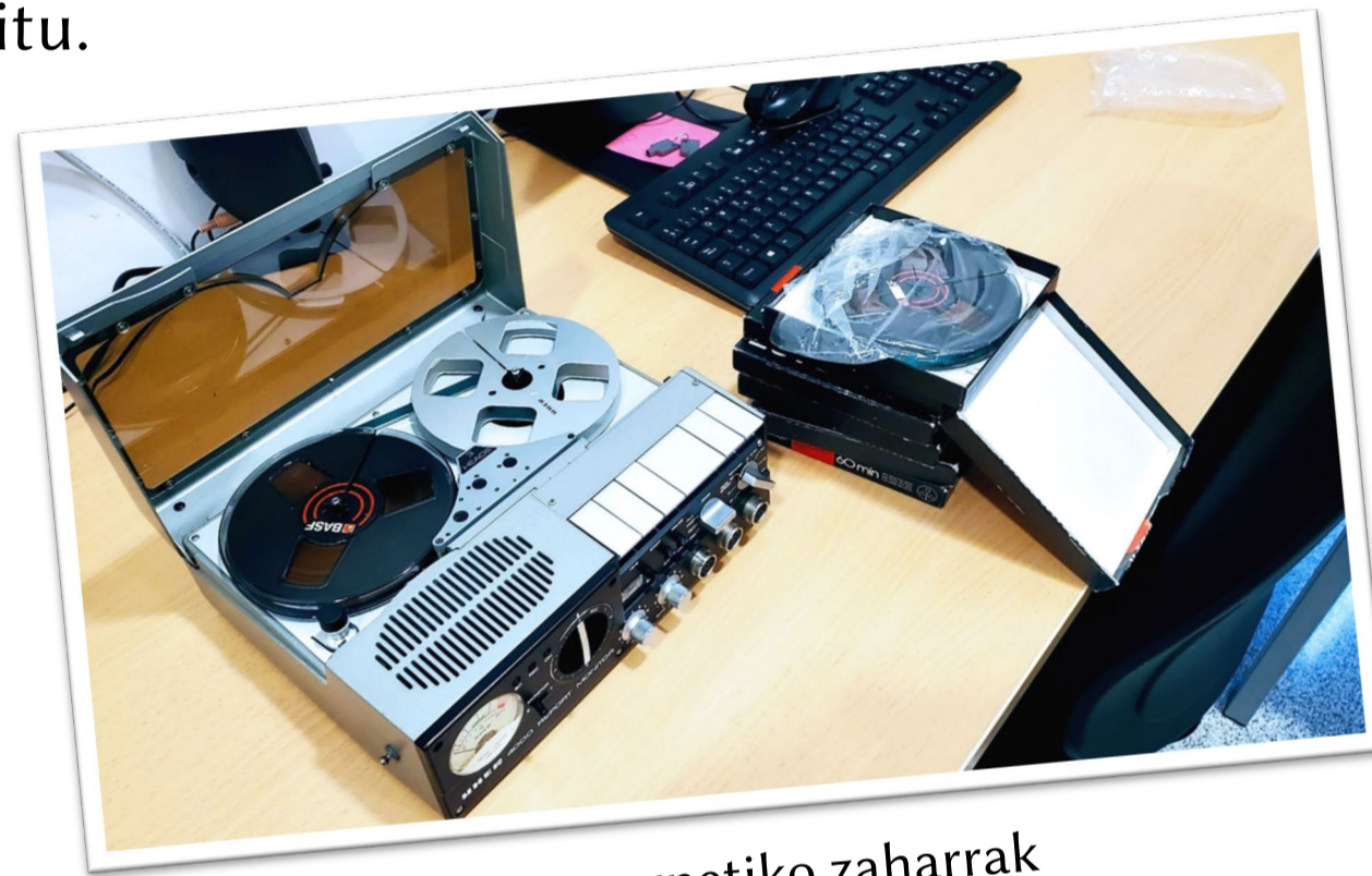
Zinta magnetiko zaharrak

Letren Fakultatean dago. Fonetikaren arloan ikerketarako eta irakaskuntzarako baliabideak ditu.