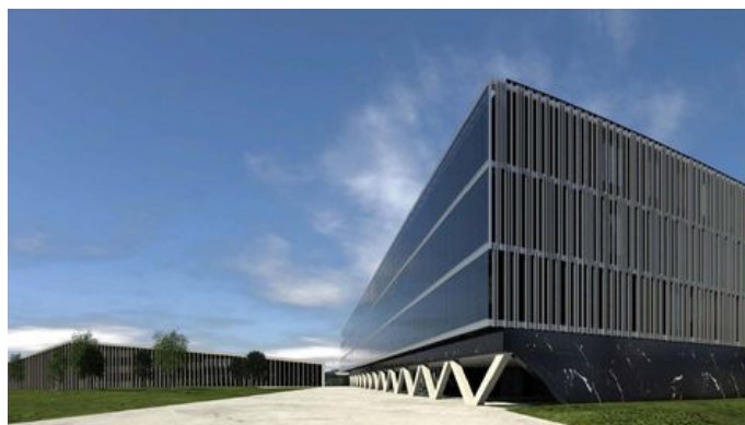
Bilboko Irakasleen Eskola (2011)