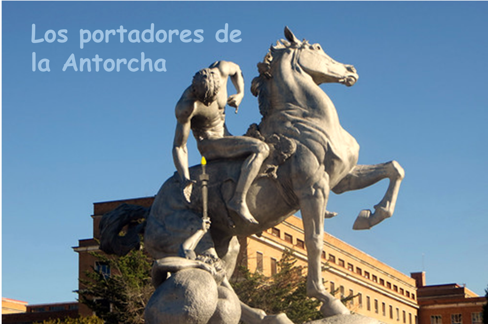
Anne Hyatt Huntington, 1955. Regalo a Madrid. UCM, Ciudad Universitaria, Campus Moncloa, Plaza de Ramón y Cajal