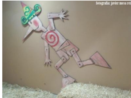
2. Pinotxoren pertsonaia, koadro, imajin edota sortu dituzten objektuetatik mugitzen du antzezleak.