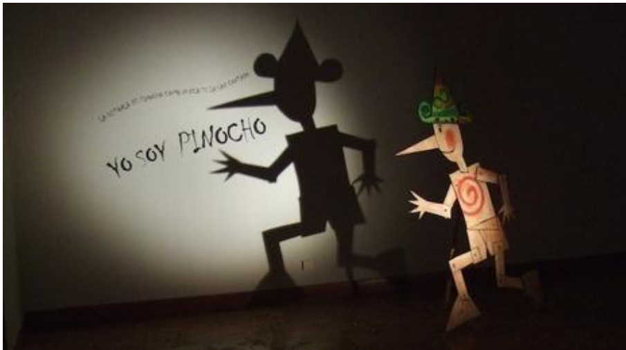
3. Itzalekin edota hitz-idatziarekin nahastu dezakegu adierazpena.