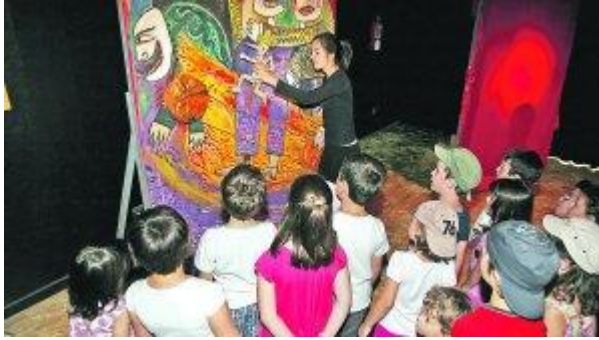
1. Antzezlea eta bisitariak