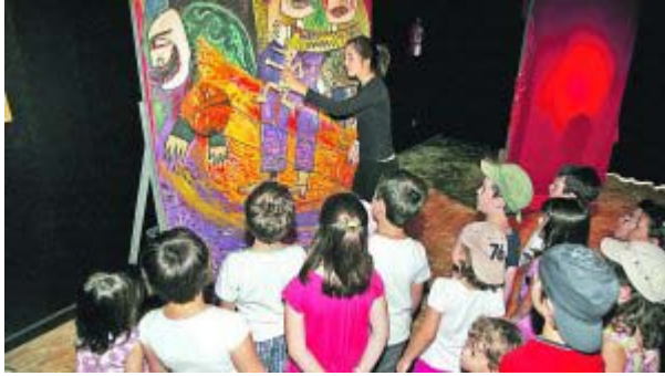
1. Antzezlea eta bisitariak