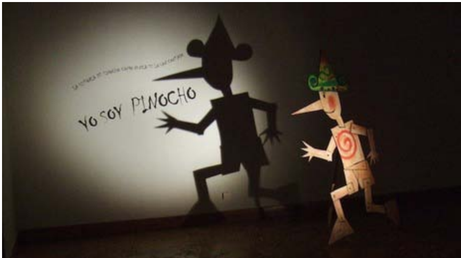
3. Itzalekin edota hitz-idatziarekin nahastu dezakegu adierazpena.