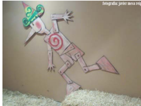
2. Pinotxoren pertsonaia, koadro, imajin edota sortu dituzten objektuetatik mugitzen du antzezleak.