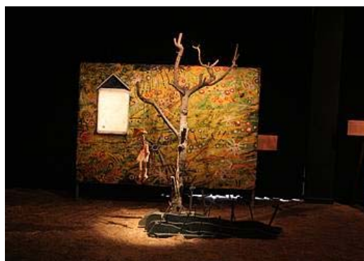
4. Eszenatokia objektu edo elementu ezberdinekin osa dezakezue.