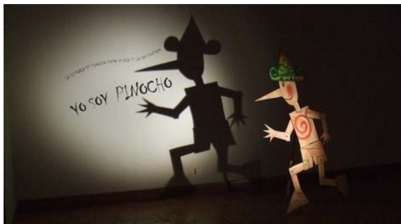
3. Itzalekin edota hitz-idatziarekin nahastu dezakegu adierazpena.