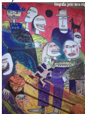
1. Antzezlea eta bisitariak

Jarraian dituzue Tolosako Topic-en oinarritutako emanaldiaren irudiak (hauez gain beste ereduak ikusteko aukera emango da ikasturtean zehar)