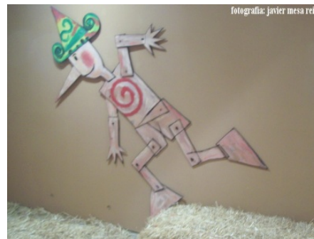
2. Pinotxoren pertsonaia, koadro, imajin edota sortu dituzten objektuetatik mugitzen du antzezleak.