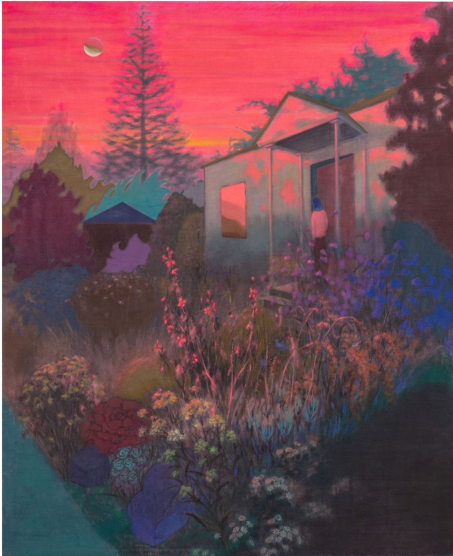
Sunset of California (2022). Guimi You. Óleo sobre lino. 203.2 x 167.6 cm

TÉCNICAS DE EXPRESIÓN GRÁFICO- PLÁSTICAS