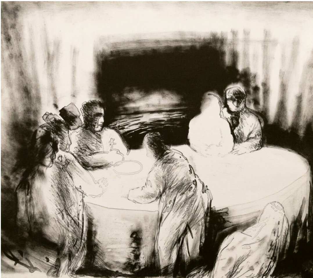
La mesa (1989). M a Puri Herrero. Akuafortea, urtinta. 50 x 54 zm

TÉCNICAS DE EXPRESIÓN GRÁFICO- PLÁSTICAS