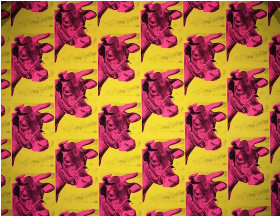
Cow Wallpaper (1966). Andy Warhol. Serigrafía paperaren gainean (zattia).