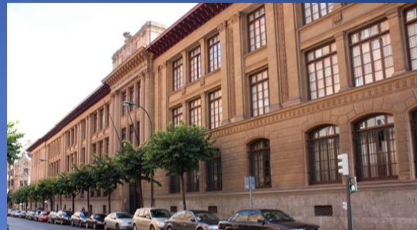
Bilbao - Elkano