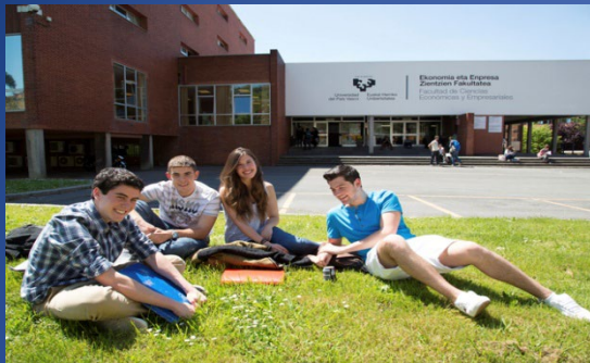
Bilbao - Sarriko