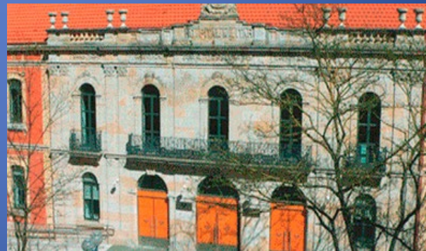
Vitoria - Gasteiz