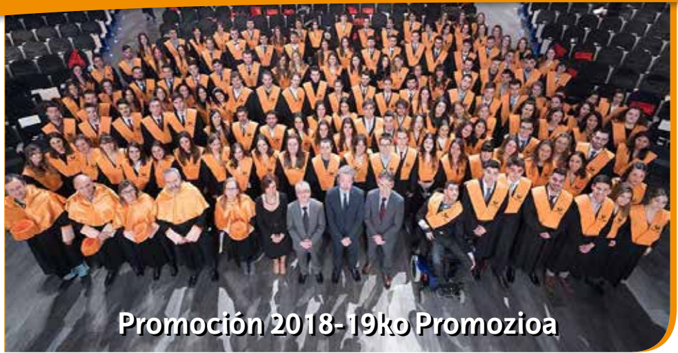
Promoción 2018-19ko Promozioa