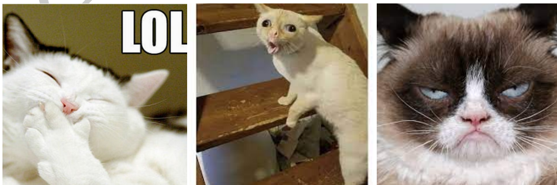
(a) Gato feliz.