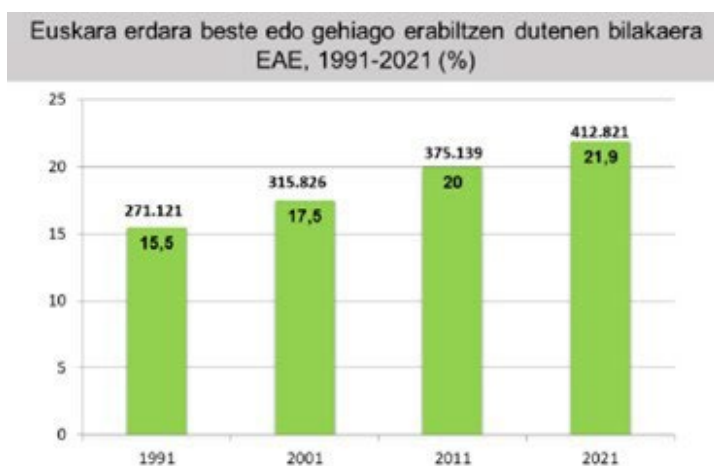
Iturria: VII. Inkesta Soziolinguistikoa 2021

Ezagutza-maila hori jardunean nola islatzen den jakitea oso lagungarria izan daiteke erabilera sustatzeko estrategiak sortzen laguntzeko. VII. Inkesta Soziolinguistikoa dioenez, «Azken 30 urteotako bilakaera aztertuz gero, euskararen erabilera 6,4 puntu egin du gora EAEn. (...) Euskararen erabilera hiru lurraldeetan eta hiru hiriburuetan gertatu da».