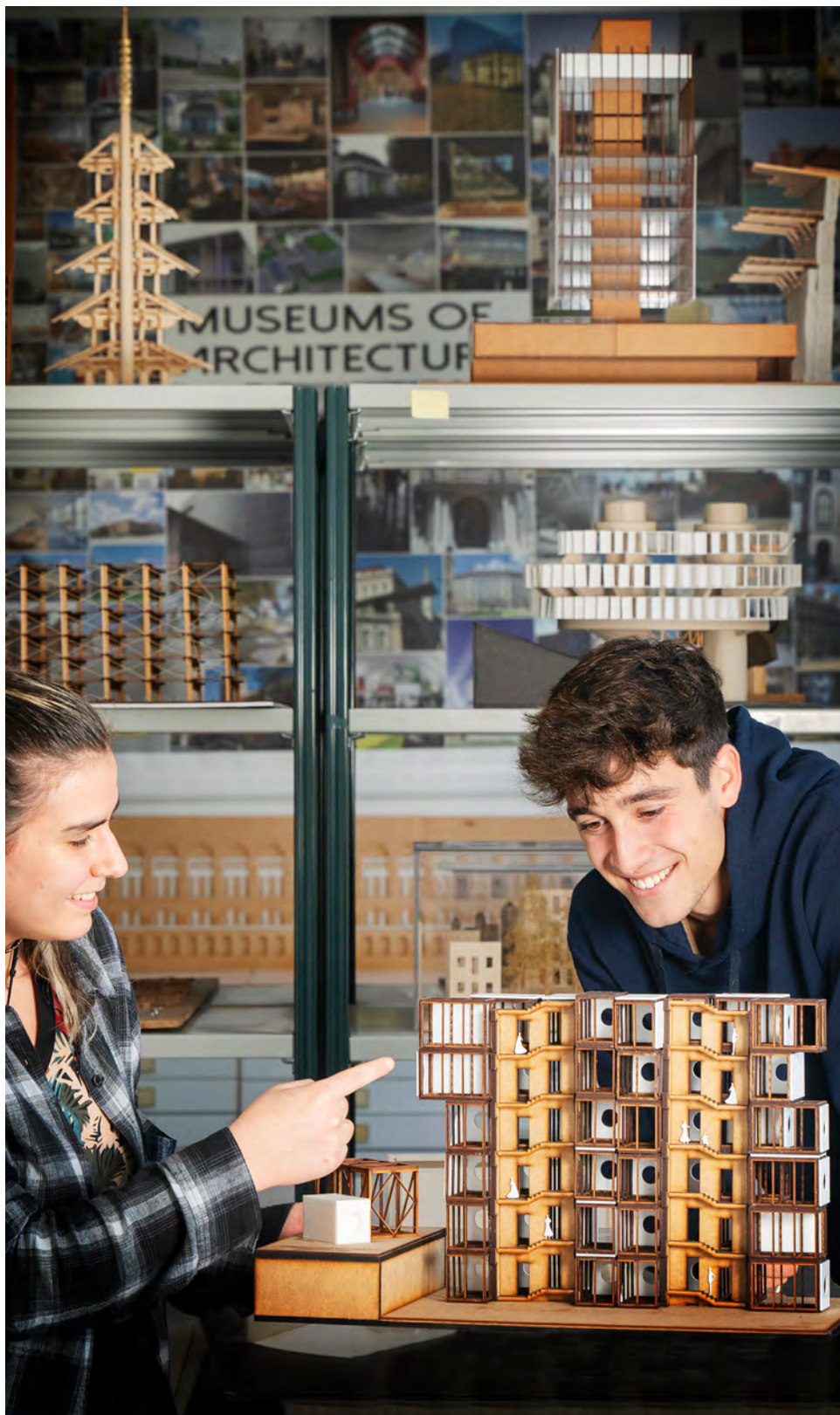
Arkitekturaren Oinarriak 6. or.