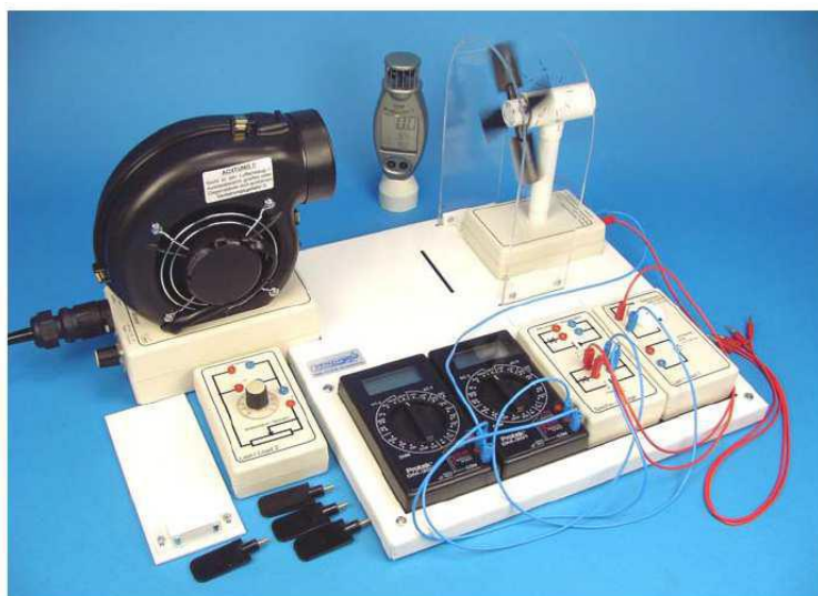
1. Irudia. Energia Eolikoaren modulua.

Modulu honek aerosorgailuen bidez sortutako energiaren azterketa kualitatiboa eta kuantitatiboa egiteko balio du. Hainbat esperimentu egiteko beharrezkoa den material guztiarekin. Potentzia erregulagarria duen haize-sorgailuak haize korrante bat sortzen du, eta haize horren abiadura kontrolatu eta neurtu egin daiteke anemometro baten bidez. Errendimendu aldea ikusteko, haize-sorgailuari pala konfigurazio desberdinak akoplatu dakizkioke palen kopuruaren, posizioaren eta formaren arabera. Erresistentzia aldakorrak eta bi multimetro digital erabiliz, kurba bereizgarriak kalkula daitezke.