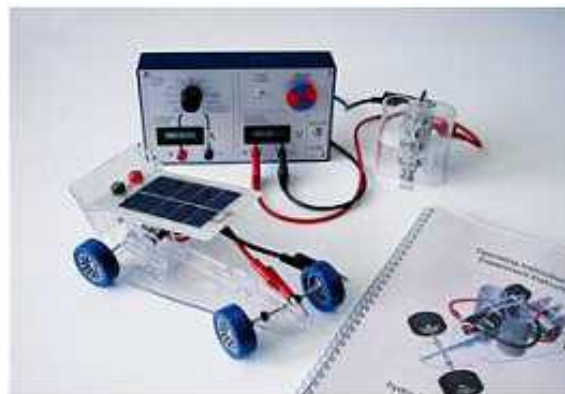
Fig 3. Módulo de coche con pila

El hidrógeno se genera en la propia pila mediante electrólisis del agua destilada. La electricidad para la electrólisis se consigue mediante un panel fotovoltaico incluido. Posteriormente, la pila consume el hidrógeno para alimentar un motor eléctrico. También puede usarse como coche solar, para ello se montará y conectará el panel fotovoltaico directamente en el coche.