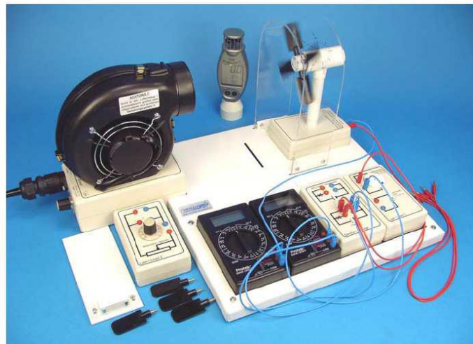
Fig 1. Módulo de energía eólica

Este módulo sirve para el estudio cualitativo y cuantitativo de la generación de energía a partir de aerogeneradores, con todo el material necesario para realizar multitud de experimentos. El generador de viento con potencia regulable suministra un chorro de viento a velocidad controlable y medible mediante un anemómetro. Al generador eólico se le puede acoplar diferentes configuraciones de palas en número, posición y forma para ver la diferencia de rendimiento. Mediante el uso de resistencias variables, cables de conexión y dos multímetros digitales podemos calcular las curvas características.