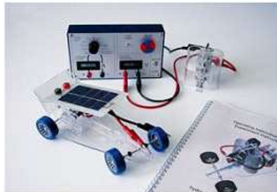
Fig 3. Módulo de coche con pila

El hidrógeno se genera en la propia pila mediante electrólisis del agua destilada. La electricidad para la electrólisis se consigue mediante un panel fotovoltaico incluido. Posteriormente, la pila consume el hidrógeno para alimentar un motor eléctrico. También puede usarse como coche solar, para ello se montará y conectará el panel fotovoltaico directamente en el coche.