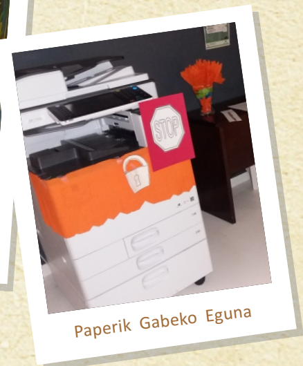
Paperik Gabeko Eguna