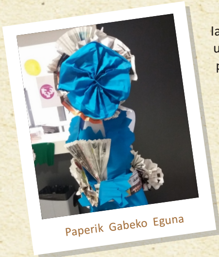
Paperik Gabeko Eguna

lazko abenduaren 16an, Paperik Gabeko Eguna antolatu zen Fakultatean, laugarren urtez jarraian. Joan diren hiru urteetan egunak izan duen harrera ona ikusita, paperik gabeko beste egun bat antolatzea erabaki genuen, eta Fakultatearen egun propio gisa finkatzea. Aurreko edizioetan bezala, jardunaldi horren helburua izan da jendea paperaren erabileraz hausnartzera bultzatzea, paper gutxiago kontsumitzea lortze aldera.