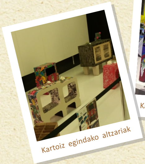
Kartoiz egindako altzariak

Iaz, Gueñesko Paperezko Jantzien Nazioarteko Lehiaketan azken edizioan aurkeztutako jantzietako batzuk izan genituen Fakultateko sarreran. Aurten, bestelako erakusketa bat izan dugu: TRATE tailerrari esker, kartoiz egindako altzariak jarri genituen Fakultateko sarreran.