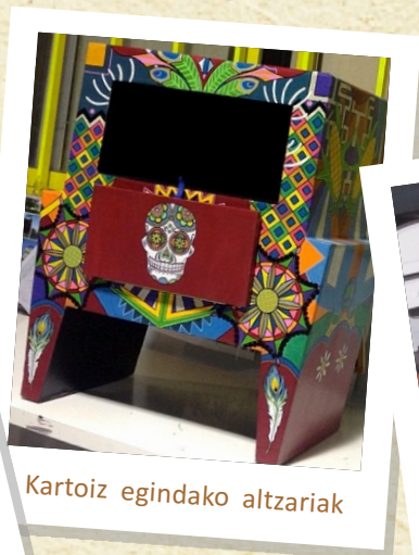
Kartoiz egindako altzariak