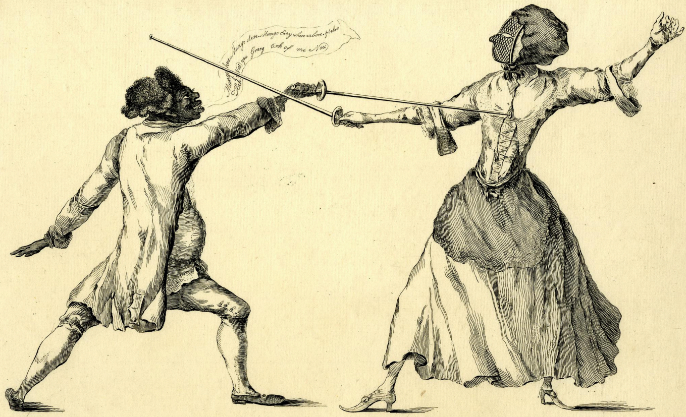
Publ d as the Act Directs May 7 th 1773