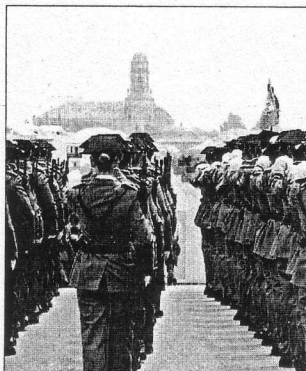
El gobierno ha renunciado a crear empleo público, salvo la contratación de policías y guardias civiles.

En relación con el paro masivo, el gobierno ha comprometido 14.430 millones de euros más para financiar el servicio público de empleo. Pero salvo la contratación de policías y guardiaciviles -unos 7.000- y personal judicial -unos 1.500 puestos de trabajo-, el gobierno ha renunciado a crear empleo público, muy necesario en todas las áreas sociales infradotadas, como la educación, la sanidad, y sobre todo la atención a dependientes. Por su parte, el Fondo Estatal para el Empleo y la Sostenibilidad Local, dotado con 4.250 millones de euros -en realidad, una reducción de 3.750 millones respecto a lo dispuesto en el plan E en este año. Estas cifras las