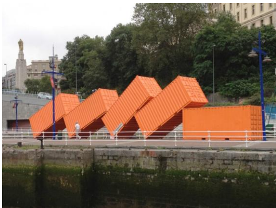
Baluarte 1, 2, 3, 4 y 5. Leo Burge y Alberto Díez. 2013

Las medidas de los contenedores que se pueden utilizar son: 1 unidad de “6mx2'5mx2'5m” 2 unidades de “3mx2'5mx2'5m” y 1 unidad de “2'40mx2mx2'12m”.