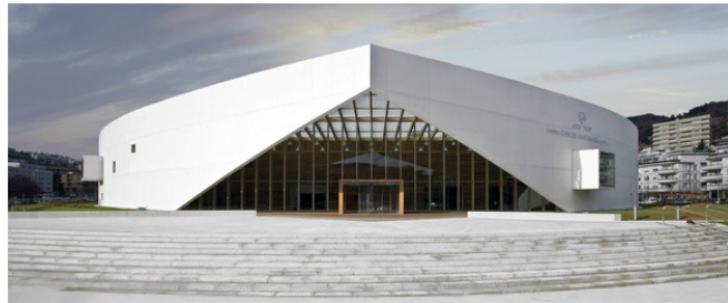
Centro Carlos Santamaría