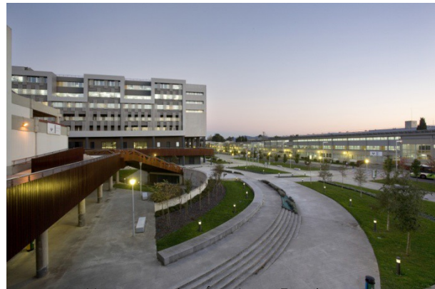
Vistas generales Área Leioa-Erandio